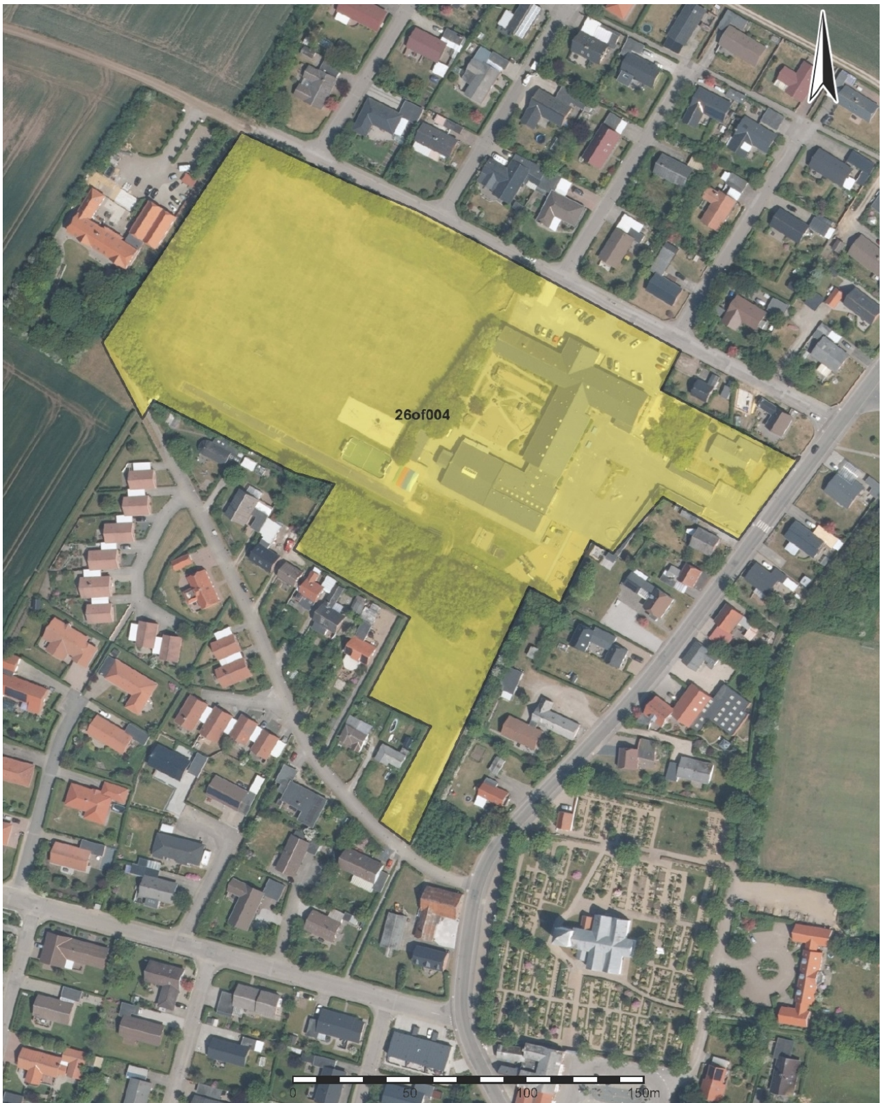
Kommuneplanramme 26of004. Der er ingen geografiske ændringer i kortet.